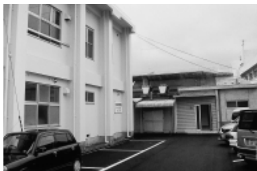
▲阿万公民館講堂後ろ部分などが増築されました

阿万公民館では、施設の老朽化や、講堂舞台と会議室の使用の利便性の向上を図ることなどを目的に、平成十六年五月から改修工事が進められていました。十一月十九日、関係者約七十人を招いて竣工式が行われました。改修されたのは、公民館棟内部の改装と外壁、屋根部分。また、講堂棟の舞台裏に不足していた楽屋機能を兼ねた会議室を増築しました。さらに、公民館棟と講堂棟をつなぐ連絡通路上屋の改修と増設がされました。