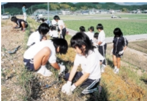
▶水仙の球根を植える児童ら