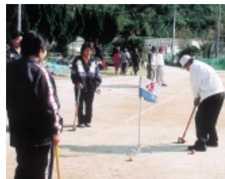
▲23チーム、143人がゲームを楽しみました