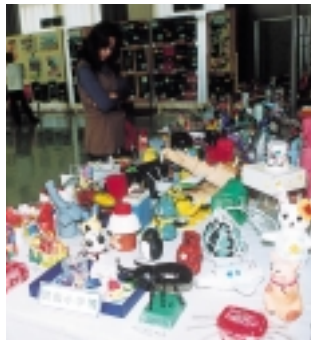
▲賀集公民館文化芸能祭