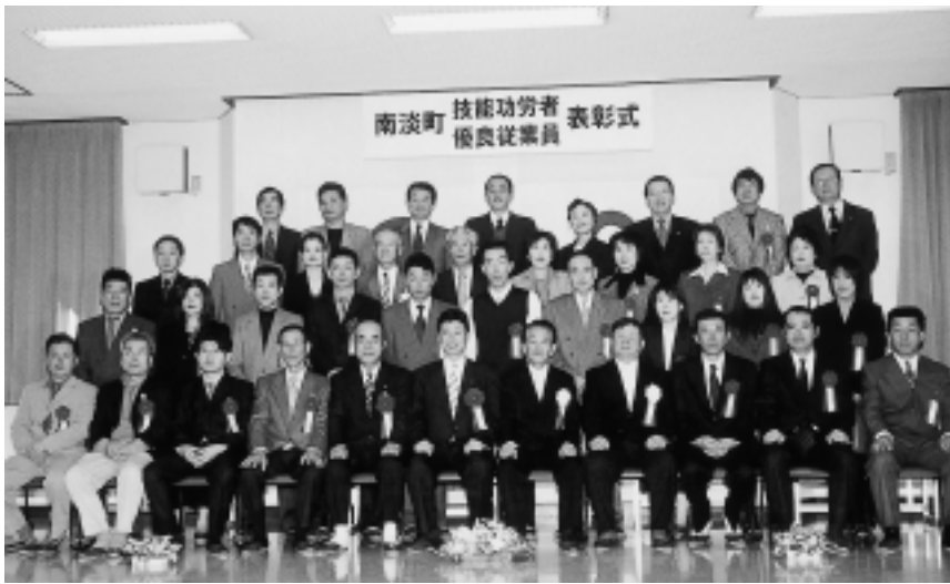
▲優良従業員の皆さん