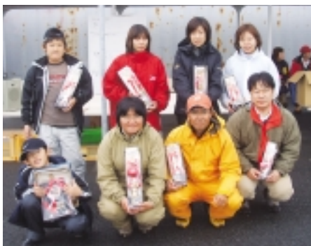
▲大漁で大喜びの受賞者