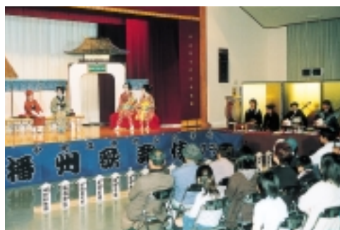
▲小学生が熱演した播州歌舞伎の舞台