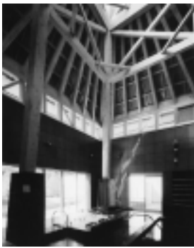
▲木や瓦の素材を生かし、癒しの空間を創出

浴室は屋外の風景を十分に取り入れ、温泉情緒豊かなA浴室と、搭状のトップライトが豊かな光を落とすB浴室が配されています。温泉は、潮崎温泉と筒井温泉を使用しています。