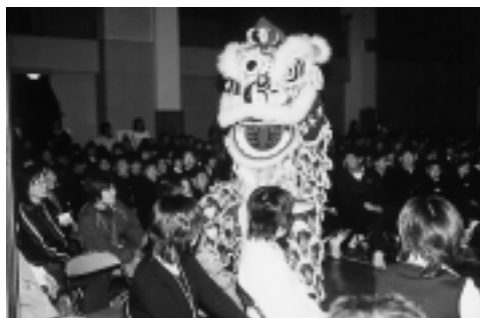
▲地域の人も生徒と一緒に「獅子舞」を鑑賞しました(南淡中)

地域の人たちに学校の授業の様子や子どもたちの活動、施設について、理解を深めてもらおうと、本年兵庫県で試行的に『オープンスクール』を開催しています。南淡町では賀集小学校と南淡中学校で十一月上旬から下旬にかけて開催されました。南淡中学校では十一月十五日、「芸術鑑賞会」があり、生徒と一緒に地域の人も鑑賞しながら、生徒たちの様子を見ました。