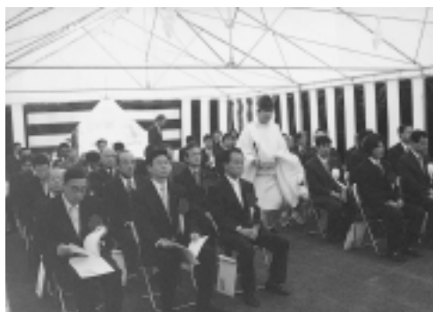
▲たくさんの来賓が訪れた、「四季の丘団地」竣工式

その後引き続き行われた入居者見学会では、入居を希望する人ら約三百名が訪れ、入居者同士が交流しやすい設計になった児童遊園所や集会所、部屋の内装などをこまめに見て回りました。