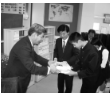
▲図書の贈呈を受ける生徒たち