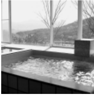
▲自然が見せる表情の変化も楽しめます

緑町の癒しの場といえばサンライズ淡路のお風呂です。今年の二月にリニューアルオープンした同施設は、サウナがスチーム式からドライ式へと変わり、浴槽に数種類の薬味を混ぜた薬湯風呂など趣向も凝らされています。また、休憩室も新しく完成し、「のんびりしてもらえ空間」をコンセプトにした畳の和室となっています。