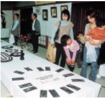
▲北阿万公民館文化祭