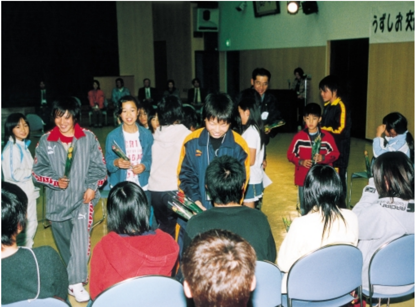
▲たくさんの思い出をありがとう！（11月21日 通学合宿「うずしお交遊塾」の閉塾式）