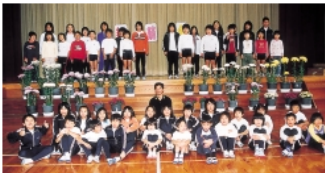
▲立派に育った菊と一緒にハイチーズ

観菊会では、指導にあたった地域の方に、児童から感謝の作文を朗読したり、菊の花を記録に残そうとグループになってちぎり絵を製作したりしました。同校では、この菊づくりのほか、炭焼きやみかんを使ってジャムづくりなども体験しています。