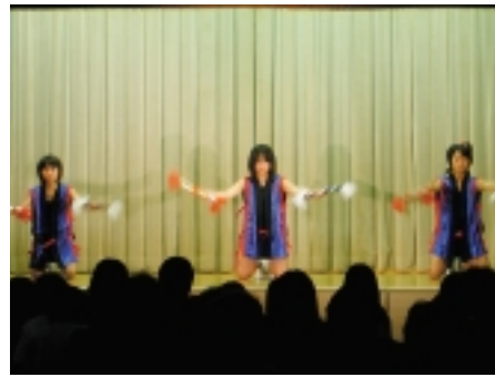
▲子どもたちによる銭太鼓の舞台(灘公民館)