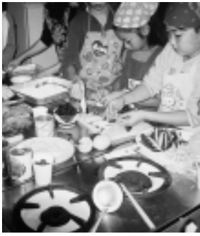
▲鱈のフライに挑戦

学校での学び以外に、地域での子どもたちにかかわる事業として、地域のおじさん・おばさんのご協力いただいております。この教室です。