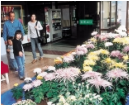
▲中央公民館文化展

展示関係では、絵画や陶芸など丹精込めて作られた力作が会場に並べられ、訪れた人はじっくりと鑑賞していました。また舞台発表では、郷土芸能や詩吟などの演目に、たくさんの方が訪れ、芸術の秋、文化の秋を楽しみました。