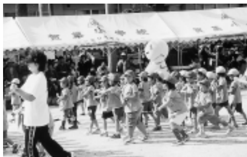
▲保育所（園）運動会では、たくさんの園児が「はばタン」ダンスを踊ってくれたね！ありがとう！

国体が都道府県対抗形式になったのは第三回福岡国体からです。このときから男女総合優勝に天皇杯、女子総合優勝に皇后杯が授与されるようになりました。天皇杯の最多獲得は東京都（十六回）で、次いで静岡県（二回）です。逆に未獲得は兵庫・岡山・山口・徳島・愛媛・高知・秋田の七県です。この九都県を除く三十八道府県は各一回ずつの受賞で並んでいます。