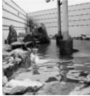
▲情緒たっぷり露天風呂（おのころ湯）

独特の感触で美人と健康の湯として知られている「うずしお温泉」は、ゆとりつくや湯の川荘などの公共施設や、町内の旅館・民宿二十七軒で入浴できます。