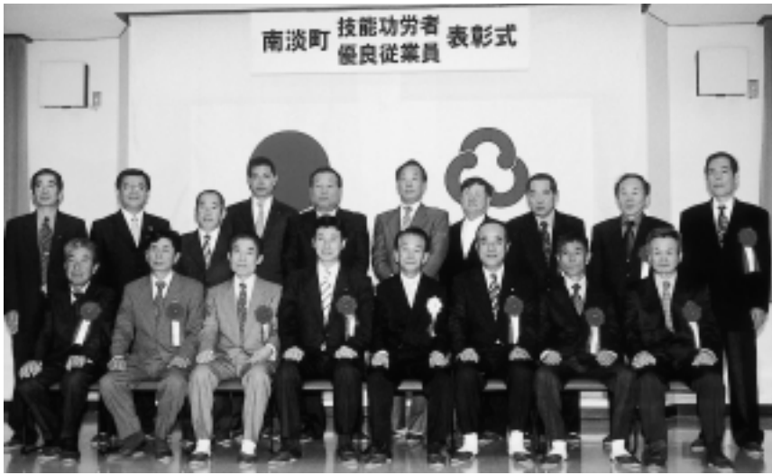
▲技能功労者の皆さん

十一月二十三日、南淡町商工会館で、優れた技能を有し、永年その技術を必要とする職業に従事して、地域社会の発展に貢献された方を表彰する『技能功労者表彰』に八名の方々と、長年勤続され、企業の繁栄に貢献された優良な従業員の方などを表彰する『優良従業員表彰』に二十七名の方々が表彰されました。 表彰者は次の方々です。(順不同・敬称略)