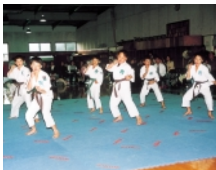
▶きびきびとした見事な演武