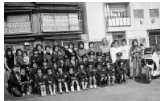
▲親子で防犯・暴力追放について学びました

福良防犯協会では、十月に防犯・暴力追放パレードを予定していましたが、雨天のため中止になりました。替わって十一月九日に福良保育園で、ちびっこ警察官を囲み、保護者らに防犯・暴力追放について注意等を呼びかけました。 また、明るい新年を迎えようと、潮美台では「潮美台スポーツクラブ21」のメンバー約六十人で、早朝から深夜まで散歩の時間を活用して防犯パトロールを行っています。